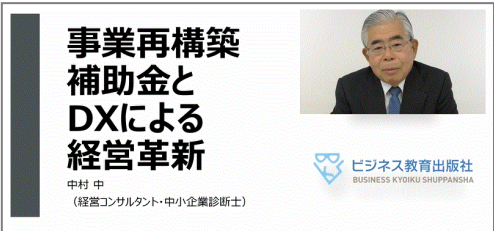
講義動画サンプル