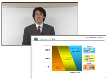
講義動画サンプル

講義動画をストーリーミング再生で視聴できます。レジュメも講義の内容に合わせて、画面に表示されます。