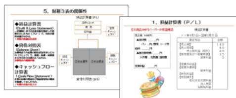
レジユメサンプル

レジユメデータを表示・ダウンロードできます。事前に印刷して手元資料とすることも可能です。