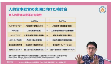
講義動画サンプル

講義動画をストリーミング再生で視聴できます。レジュメも講義の内容に合わせて、画面に表示されます。