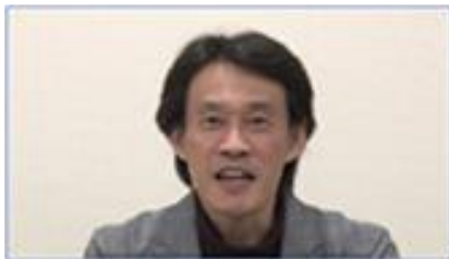
講義動画サンプル

講義動画をストリーミング再生で視聴できます。レジュメも講義の内容に合わせて、画面に表示されます。