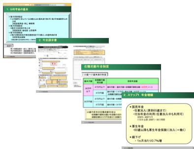
レジュメサンプル

レジュメデータを表示・ダウンロードできます。事前に印刷して手元資料とすることも可能です。