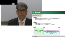
講義動画サンプル